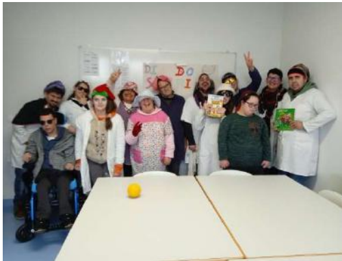
CACI – Santegãos, Rio Tinto