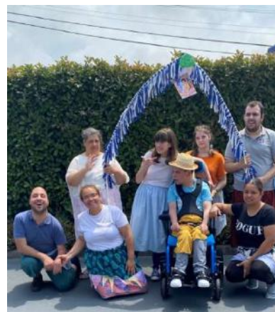
CACI – S. João