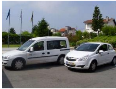
Viaturas e equipa de SAD

O Serviço de Apoio Domiciliário foi uma das respostas sociais imprescindíveis que teve sempre continuidade mesmo na evolução da pandemia. No ano de 2023, o número de serviços e sua periodicidade contratualizada por cada utente foi: