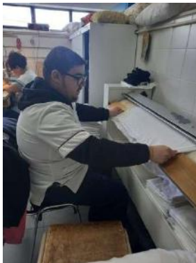
Curso 4 | Empregado/a de Andares