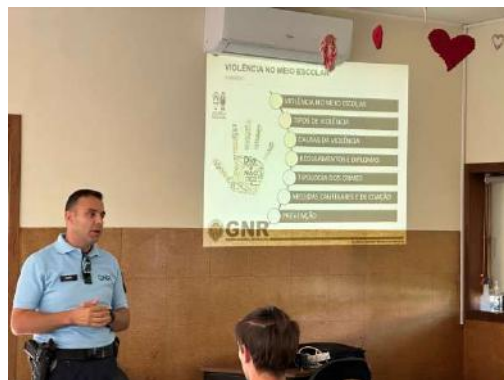
Sessão dinamizada pela GNR sobre bullying e cyberbullying.