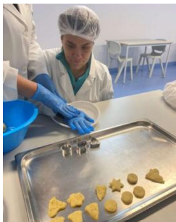
CACI – Sessão de culinária