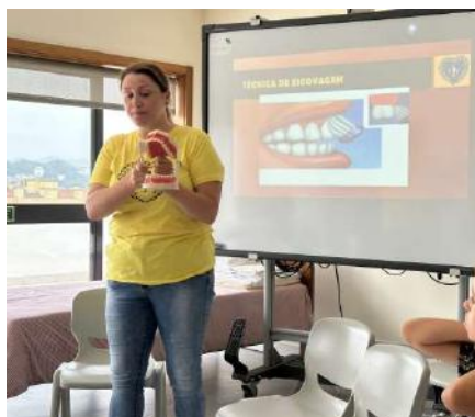
Sessão de sensibilização sobre saúde oral dinamizada pela Legião da Boa Vontade.