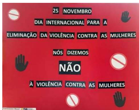
Atividade no âmbito do Dia Internacional pela Eliminação da Violência contra a Mulher.

Ao longo do ano, o grupo “Olhares” também realiza trabalhos manuais, que são expostos e vendidos na Exposição de Natal da Fundação Nuno Silveira. O lucro das vendas reverte na totalidade para a aquisição de novos materiais para o grupo, uma vez que é auto-sustentável, e/ou para a realização de atividades.