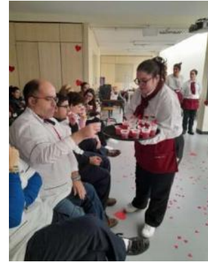
Curso 5 | Empregado/a de Mesa