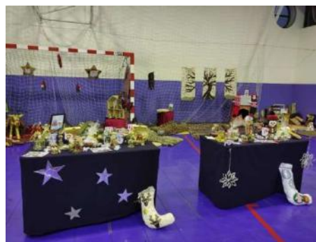
CACI - Exposição e venda de Natal