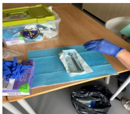
Rastreios de saúde oral realizados pela Legião da Boa Vontade.