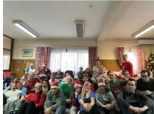
Lar Residencial – Sede, Fânzeres