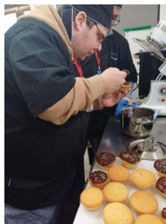
Curso 2 | Ajudante de Cozinha e Pastelaria