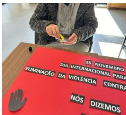
Atividade no âmbito do Dia Internacional pela Eliminação da Violência contra a Mulher.

Para além disso, celebramos datas importantes, como foi o caso do dia 25 de novembro - Dia Internacional pela Eliminação da Violência contra a Mulher, num trabalho conjunto com a Junta de Freguesia de Rio Tinto.