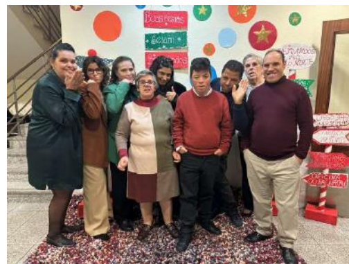
Jantar de Natal