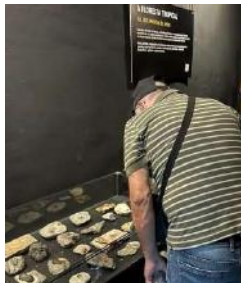
Visita dos grupos ao Museu Mineiro.