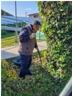
Curso 3 | Operador/a de Jardinagem