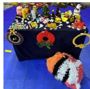
Trabalhos realizados no Grupo “Olhares”, na XXV Exposição e Venda de Natal.

Ao longo do ano, o grupo “Olhares” também realiza trabalhos manuais, que são expostos e vendidos na Exposição de Natal da Fundação Nuno Silveira. O lucro das vendas reverte na totalidade para a aquisição de novos materiais para o grupo, uma vez que é auto-sustentável, e/ou para a realização de atividades.