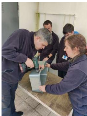
Curso 1 | Ajudante de Jardinagem e Manutenção de Instalações