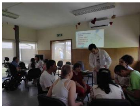
CACI – Ação sensibilização sobre higiene oral