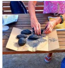
Atividade “ Os Briquetes”, realizada no Museu Mineiro.

Foi criado e dinamizado, pelas Assistentes Sociais de ambas as equipas, um grupo de pais, intitulado “Pais à conversa”, com o objetivo de partilhar questões relacionadas com a parentalidade.