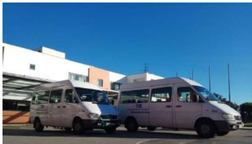
Viaturas do Serviço de Transportes

O serviço de transportes assegurou o transporte diário de casa para o centro e de casa para a escola, com acompanhamento personalizado de 85 clientes, de acordo com as tabelas abaixo: