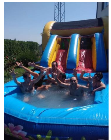
Jardins da Fundação