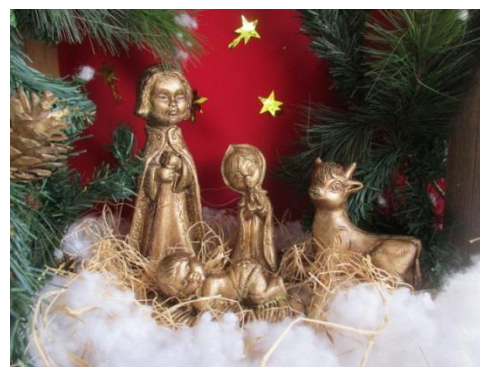
Peças produzidas no CAO