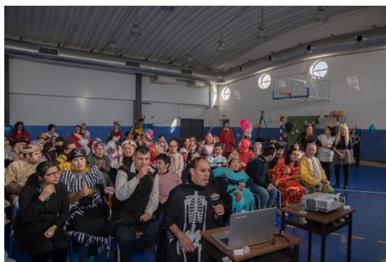
Os utentes de CAO e Lar Residencial