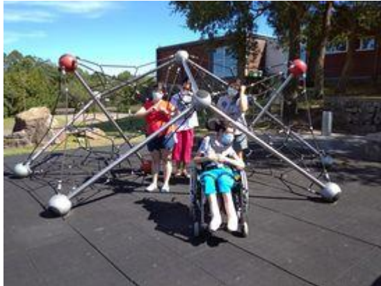
Parque do Avioso (Maia)

Ao longo do mês e agosto foram dinamizadas diversas atividades que pretenderam promover o desenvolvimento pessoal e social, o contacto com a natureza e a comunidade, a prática de desporto e o divertimento.