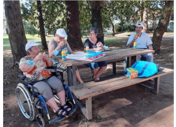
Parque do Carriçal (Senhora da Hora)