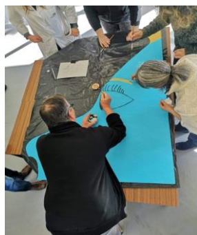
Silhueta feminina em execução

Esta atividade consistiu na pintura e decoração livre de uma silhueta feminina envolvendo o Grupo “Olhares” e o Grupo “Percurso”, de forma a ser exposta num local público.