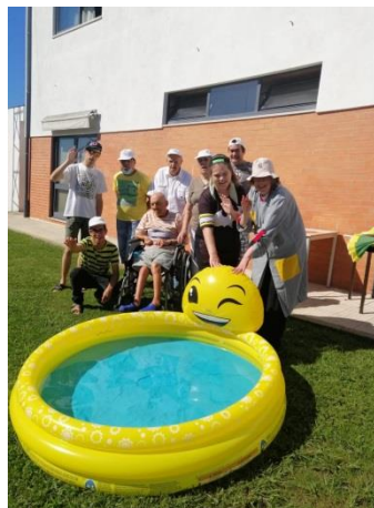
Jardins da Fundação