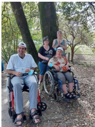
Parque do Carriçal (Senhora da Hora)