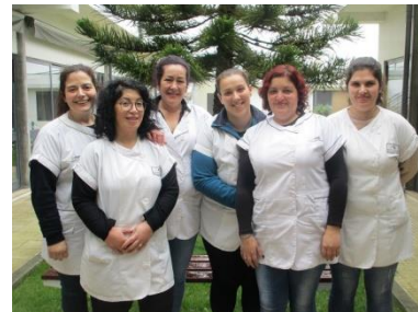
Viaturas e equipa de SAD

O Serviço de Apoio Domiciliário é uma das respostas sociais imprescindíveis de dar continuidade em caso de evolução de epidemia do COVID-19 no entanto, a cada momento, foi efetuada uma avaliação casuística das situações prioritárias para intervenção no domicílio pelas ajudantes de ação direta.